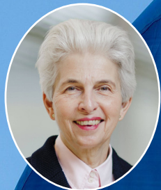
FDP-Europaspitzenkandidatin Dr. Marie-Agnes Strack-Zimmermann MdB